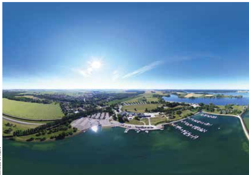
VIR360 et ADN