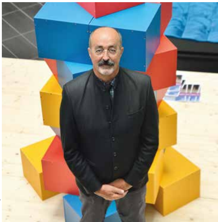
F. Marais/Agence Info