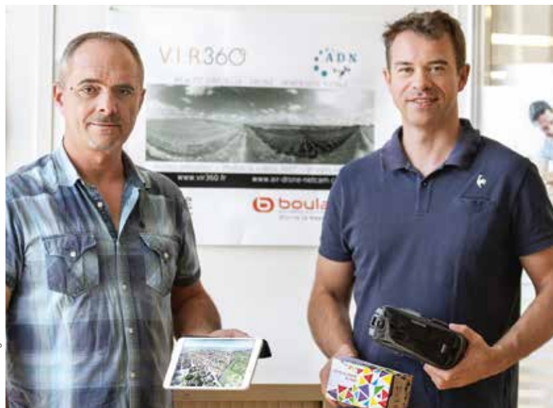
P. Schilde - Agence Info