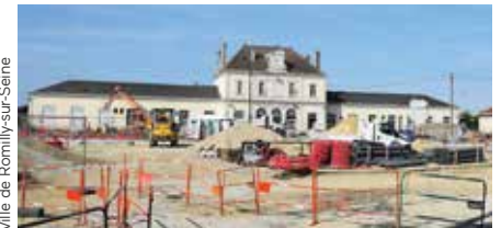
Ville de Romilly-sur-Seine

Le Département a décidé de soutenir financièrement la commune des Riceys dans la création d'un centre dédié à l'œnotourisme, secteur en plein essor. Cet équipement accueillera des touristes, des classes découverte, et proposera des formations, des réunions professionnelles ainsi que des séances de dégustation.