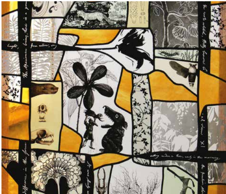
Maison du vitrail